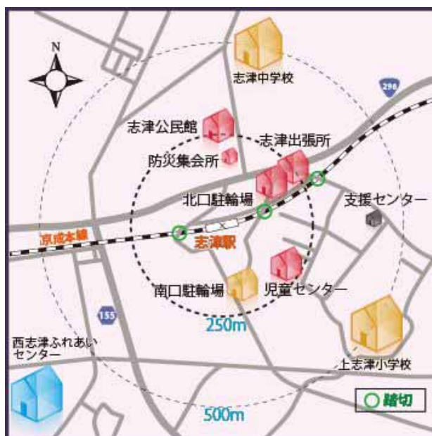
【志津駅周辺の施設配置状況】

また、同じく志津地区にある西志津ふれあいセンターは敷地面積 3,000 m 2 に対し延床面積 5,100 m 2 ですが、対象施設の合計では、敷地面積 7,300 m 2 に対し延床面積は 5,000 m 2 と、駅前という好立地でありながら敷地面積に対する延べ床面積の割合が低く、今後の社会経済情勢を見据えた敷地・施設の有効活用を図っていくことが必要です。