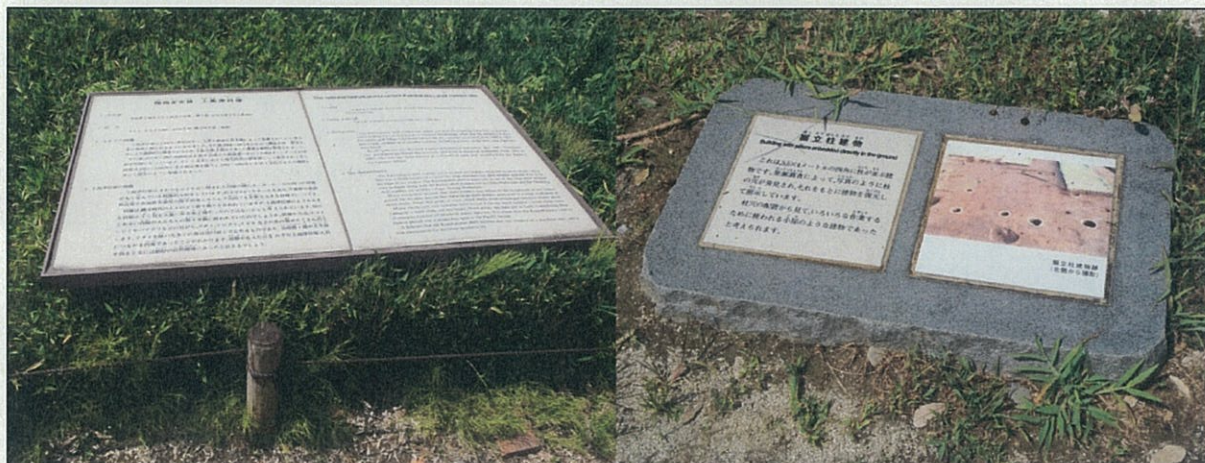
説明プレート (参考例)