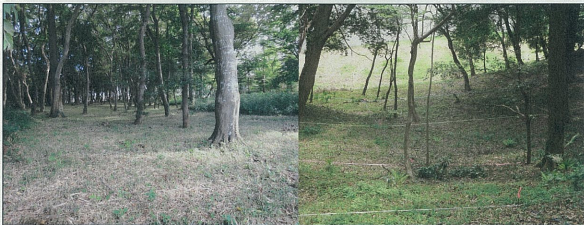
居住・盛土エリア現況

「廃棄エリア」は盛土エリアの東側斜面で、一部は埋め立て造成されたと考えられる部分である。斜面の崩落を防ぐため園路を設けず、調査時の写真を入れた説明板を設置する。