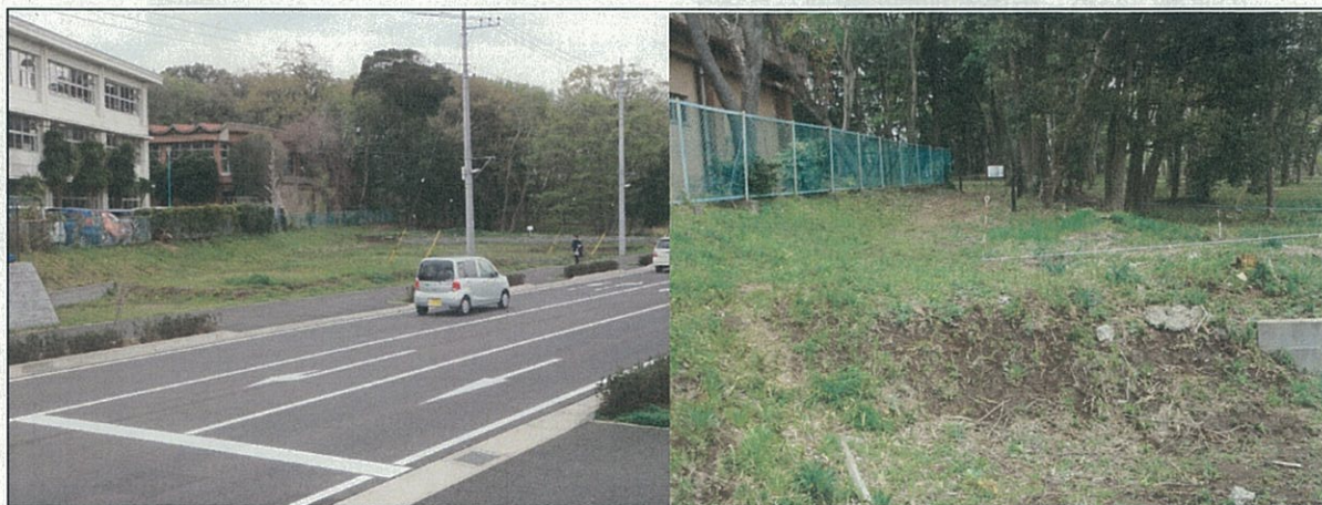
サービスゾーン近景（国道296号線沿い）

なお、指定地周辺はすでに土地区画整理がなされ、駐車スペースの確保が困難であることから、ガイダンス施設に重点を置いた土地利用を検討する。また、トイレは建物内に併設する方向で検討する。