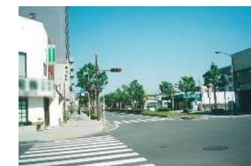
京成臼井駅南口 無電柱化

公共施設は、景観形成の先導的な役割を担う。 （印旛沼周辺、佐倉城の城下町のエリアについては、積極的に景観形成を図る。）