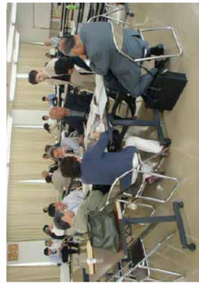
合同作業部会風景

もし、あなたのお宅にアンケートが届きましたら、お忙しいところ誠に恐縮ですが、調査趣旨をご理解いただき、あなたのお考えをご回答いただきますようお願い致します。