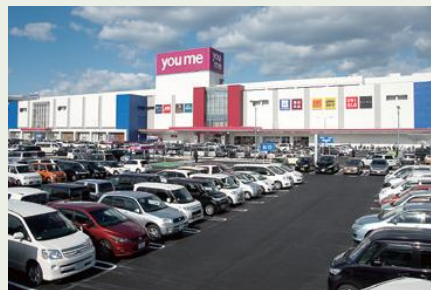
複合大型商業施設の建設