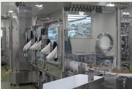
医薬品製造工場の建設