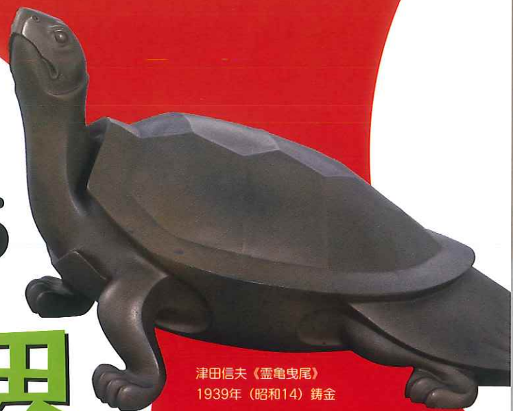
津田信夫《靈龜曳尾》 1939年(昭和14) 鍍金