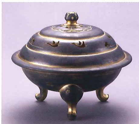
香取正彦《麗銀金彩薫炉》1987年（昭和62）鍍金