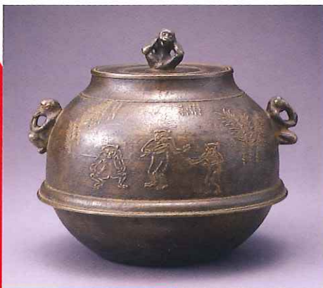
香取秀真《白銅三猿釜》1944年（昭和19）鍍金