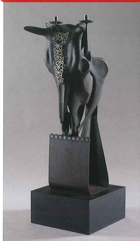
鈴木治平《燭》1979年（昭和54）鍍金