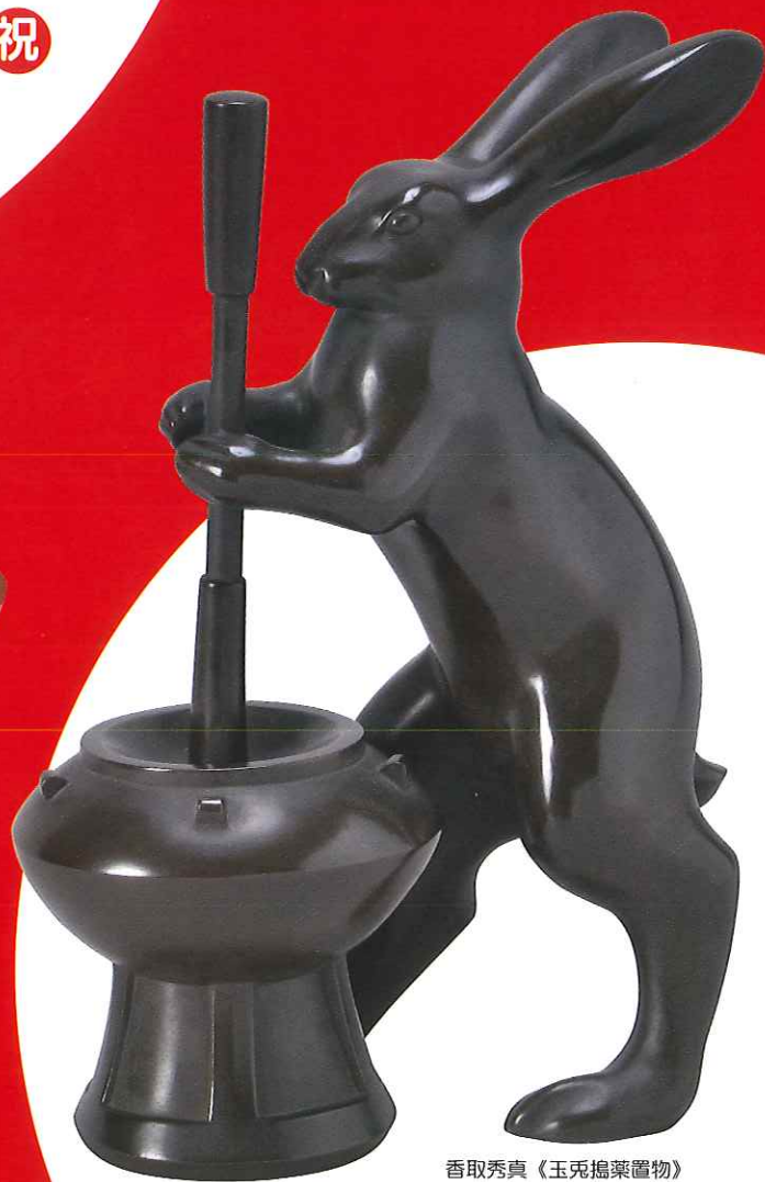
香取秀貞《玉兔搗薬置物》 鍍金