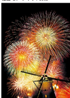
佐倉花火フェスタ