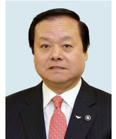
Kazuo Warabi Alcalde de Sakura

Finalmente, mis sinceros deseos de un nuevo año lleno de felicidad y salud para todos.