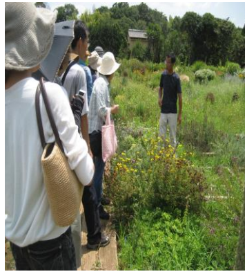
様々な種類のハーブを見学

新型コロナウイルス感染症拡大の状況によっては、主催事業の中止・内容変更をする場合があります。サークルや主催事業で公民館活動をする際は事前検温・マスク着用をお願いします。