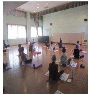
活動を通じた交流も楽しみ

市のホームページに「 根郷公民館利用案内 」を掲載しました。利用にあたっての注意事項・お願い・