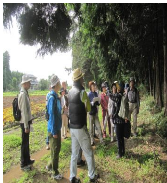
散策しながらの野草観察

★根郷ふるさと探訪野草観察会 根郷地区を散策しながら、季節の野草や古木を観察し、郷土の自然を楽しみましょう。