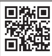
「ワクチン接種予約」サイト 二次元コード