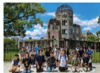
令和4年 広島訪問時