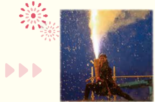
大迫力の手筒花火を間近で見られるのはS会場だけ!