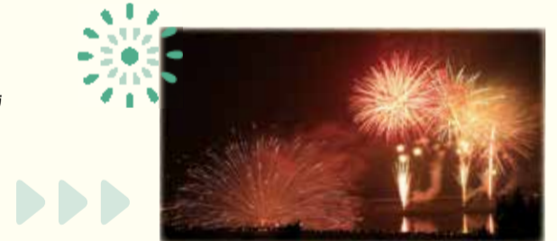
観覧席が高台にあるので、いつもとは違った花火を楽しめます!