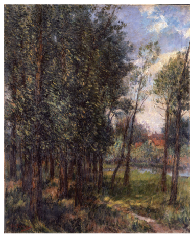
都鳥英喜《夏(グレー風景)》大正9年