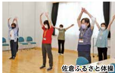
佐倉ふるさと体操

「佐倉ふるさと体操」は、「故郷」の歌に合わせて、立ってでも座ってでも行うことができる体操です。印旛沼の漁をイメージする動きなど、佐倉にちなんだ動きを取り入れています。