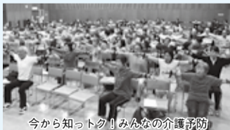
今から知って! みんなの介護予防