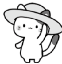
しりあぶりねこ