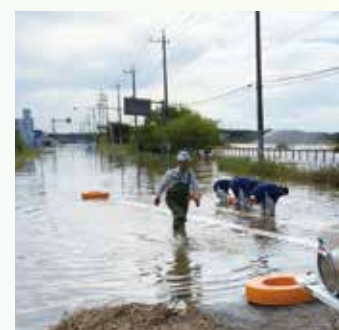
令和元年10月の大雨で冠水した国道296号 (鷹匠橋～鹿島橋・令和元年10月26日撮影)

印旛沼の最下流に位置する佐倉市では、洪水調整機能の強化が地域課題の一つとなっています。近年では、地球温暖化などの影響により、ゲリラ豪雨の頻発化など、河川の氾濫リスクも一層増大しています。令和元年10月の大雨では、道路への冠水や土砂崩れなど、市内でも大きな被害が発生しました。