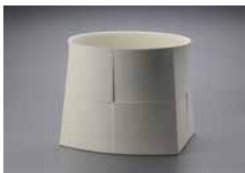
《白器「ダイ/台」》2018年 国立工芸館蔵

佐倉に窯を築き、多数の作品が主要な陶芸の公募展で受賞している、現代日本を代表する陶芸家 和田 的の公立館における初の大規模個展。