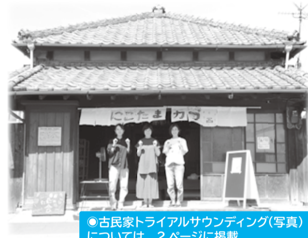
●古民家トライアルサウンディング(写真)については、2ページに掲載

市では、集客・消費の促進による地域経済の活性化のため、空き店舗などで事業を始めるかたへの支援や、古民家(旧今井家住宅、旧平井家住宅)でのトライアルサウンディングを行っています。