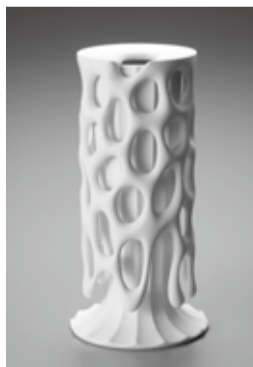
《白器「ENERGY TREE」》2020年

学生時代から最新の磁器作品のほか、彫刻や版画などジャンルを越境した創作活動の軌跡を振り返ります。