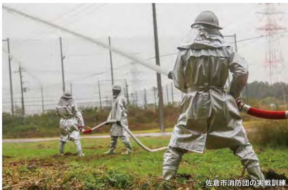
佐倉市消防団の実戦訓練