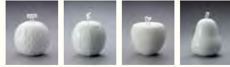
《フルーツ水指》左から「メロン」「スイカ」「りんご」2012年「ラ・フランス」「パイナップル」2011年