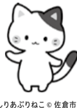
しりあぶりねこ © 佐倉市