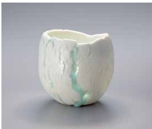
《茶盃「御神渡り」》2020年 国立工芸館蔵