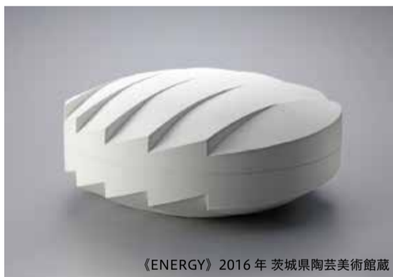
《ENERGY》2016年 茨城県陶芸美術館蔵

磁土をろくろで厚くひき、彫刻のように削り出す技法から生まれる、エッジのきいた直線と曲線、光と影のコントラストが特徴。