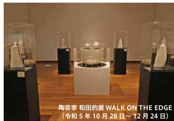
陶芸家 和田的展 WALK ON THE EDGE (令和5年10月28日～12月24日)