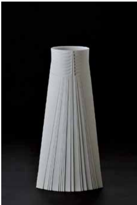
《白器「天使の梯子」》2023年