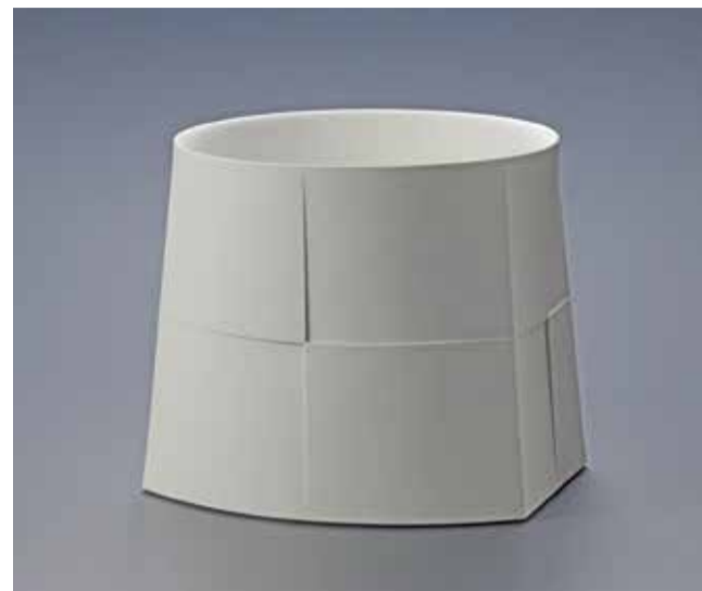
《白器「ダイ/台」》2017年 第64回日本伝統工芸展 東京都知事賞受賞