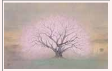
伊藤彬『佐倉の春』昭和58年