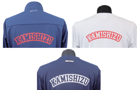
ロゴマーク (ジャージ上・Tシャツ背中)