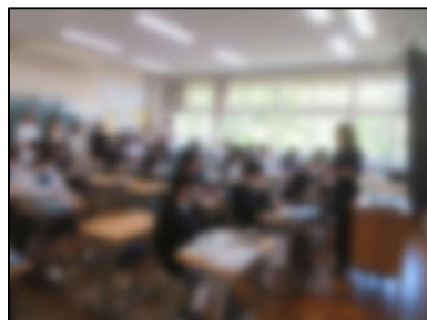
2組英語「1年生で習ったことをもとに本文を読もう」