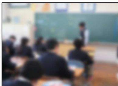
1組数学「単項式と多項式について学ぼう」

4月16日(木)に授業参観が開催されました。心配されていた雨も上がり、多数の保護者の方々にご参観いただきました。当日は学級担任がそれぞれの専門教科の授業を行いました。授業のねらい提示や指導法の工夫、生徒の学ぶ姿勢、担任と生徒・生徒同士の人間関係など、短い時間ではありましたが、雰囲気を感じていただけたのではないのでしょうか。引き続き行われた保護者会は、学年・学級ともに急遽体育館アリーナを会場に変更しましたが、こちらにも多数ご参加いただきました。ありがとうございました。