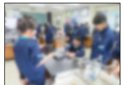
3組理科「炭酸水素ナトリウムを加熱すると、どのような変化が起こるのだろうか」