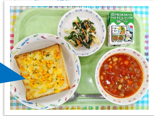
・コーンポテトースト ・ほうれん草とツナのサラダ ・チリコンカンスープ ・牛乳

こんがり焼けたマヨネーズとパンの香ばしさ、 ポテトのホクホク感、そしてコーンのフキフキ とした甘さが絶妙にマッチ！