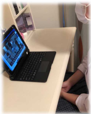
学校と家庭の オンライン通信