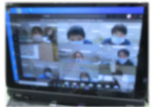
教職員同士のオンライン研修