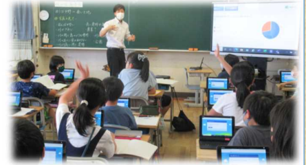
ノートとタブレットの併用