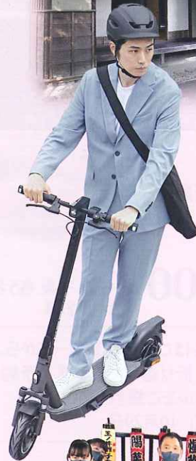
電動キックボード体験