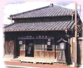
明治時代の 呉服屋 駿河屋 旧今井家住宅