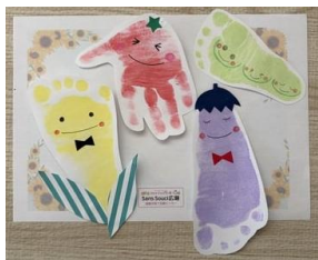
手形足形アート 夏野菜さん達↓

(注) ■産後ママ教室 第1or第3金曜に開催しています。Instagram・HPにて開催日と予約日を確認できます。