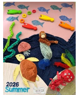
お昼寝アート ~夏バージョン~↓

広場に遊びに来た時にスタッフにこっそり聞くとちょっとした情報もゲットできるかも!?