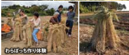
わらぼっち作り体験