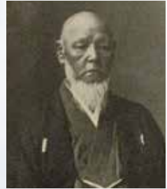
津田仙像 (青山学院資料センター所蔵)

江戸末期、オランダとの交易が非常に深かった佐倉で、佐倉藩士として生まれ育った津田仙は、江戸幕府の通訳官として渡米。米国での生活・文化・社会を学び、国内での女子学校の設立に尽力しました。その後、明治維新の到来で失職した仙は、農業指導者となり、いち早く海外から先端農業技術を取り入れ、アスパラガス、アメリカりんご、オランダいちご、西洋ユリを試植。育種方法や栽培方法をまとめあげた「農業三事」を出版、たちまちベストセラーとなりました。養豚も研究し、幅広く実践家として日本農業の発展に貢献しました。