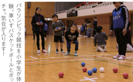
パラリンピック競技を小学生が体験。車いすバスケットボールとボッチャ。気合が入ります！