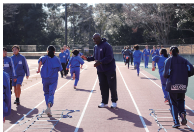
小中学生への本格指導。アメリカ陸上チームコーチが指導する陸上クリニック！