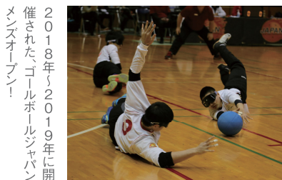
2018年〜2019年に開催された、ゴールボールジャパンメンスオープン！