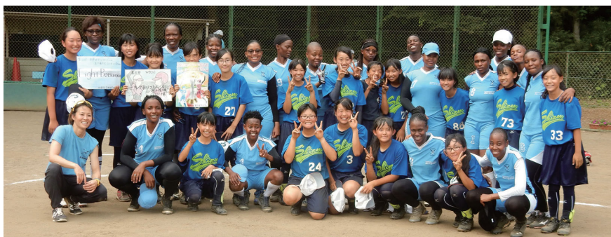
ボツワナ女子ソフトボールチームと中学生ソフトボール部の交流も！

市民の機運を高めるため、オリンピック・パラリンピック競技の体験イベントや小中学校での体験会を行っています。また、パラリンピック種目ゴールボールの国際大会を開催しました。