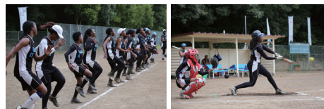
2018年、第16回世界女子ソフトボール選手権に参加するボツワナ代表が岩名運動公園で事前キャンプ。