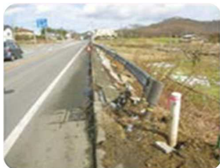
ガードレール・ 標識等の損傷