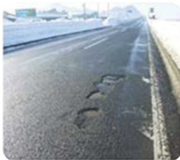
路面の穴ぼこ・段差