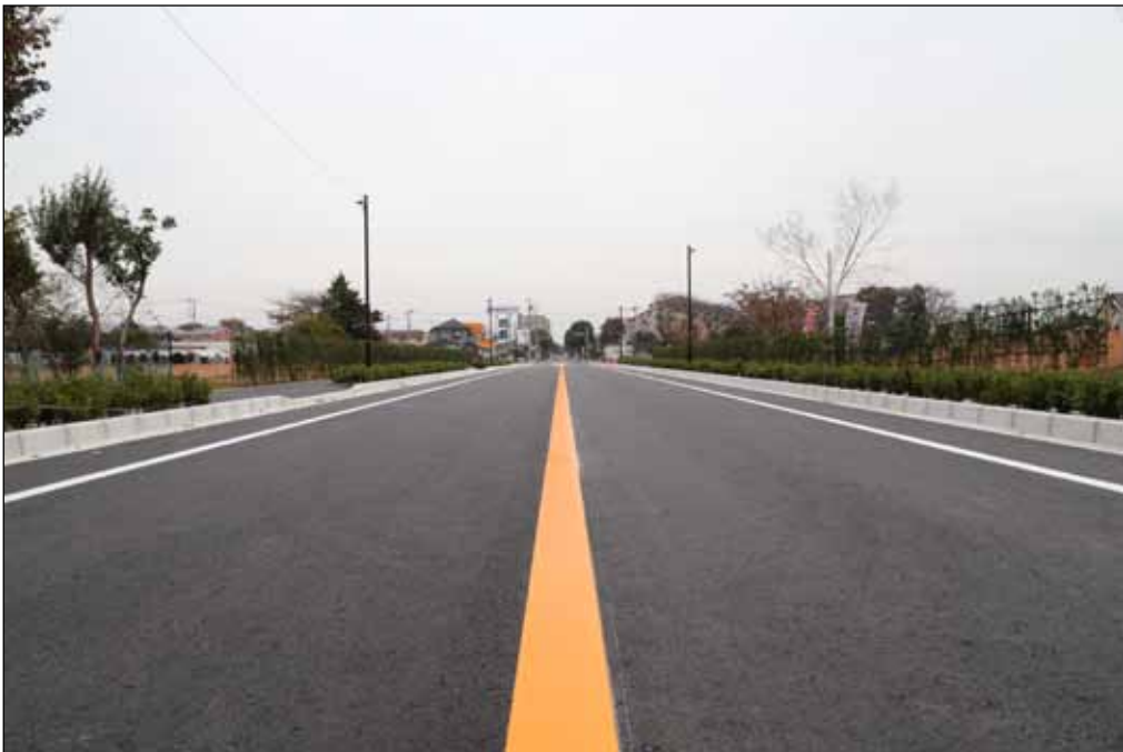
八千代市側より佐倉市側を望む