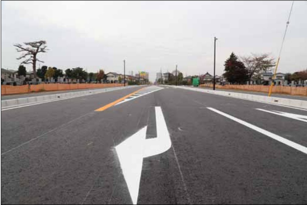
佐倉市側より八千代市側を望む