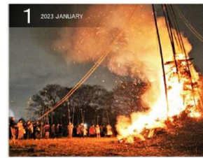
青菅のどんどれえ