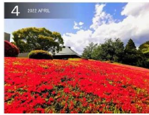
D I C 総合研究所