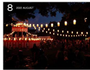
上志津原の盆踊り大会