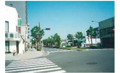
京成臼井駅南口 無電柱化

公共施設は、景観形成の先導的な役割を担う。 (印旛沼周辺、佐倉城の城下町のエリアについては、積極的に景観形成を図る。)