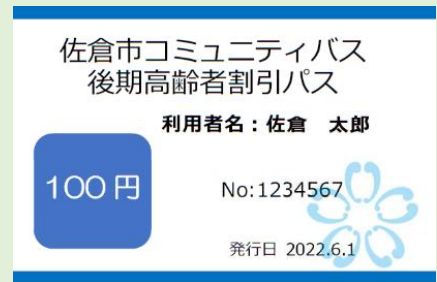
※後期高齢者割引パスイメージ