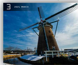
佐倉ふるさと広場