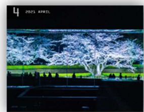
国立歴史民俗博物館