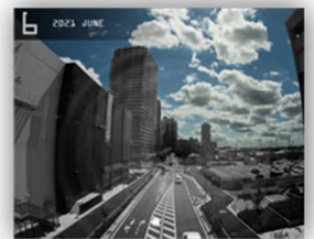
ユーカリが丘イオンタウン