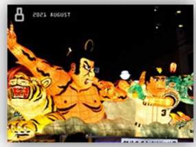
白井ふるさとにぎわい祭り