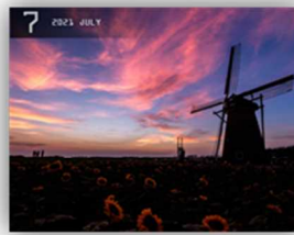
佐倉ふるさと広場