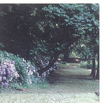
アジサイ (菖蒲園付近)