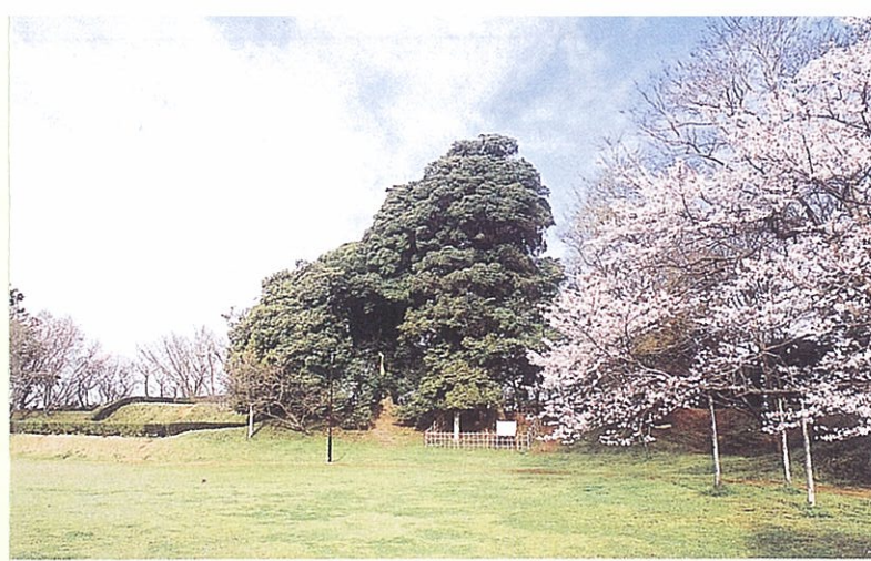
本丸跡 天守閣跡と夫婦モッコク