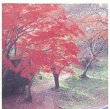
紅葉 (あずまや付近のイロハモミジ)