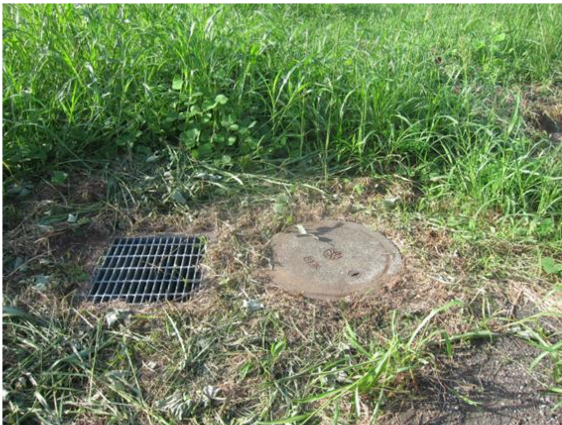
⑫ 雨水桝、污水桝（敷地内）