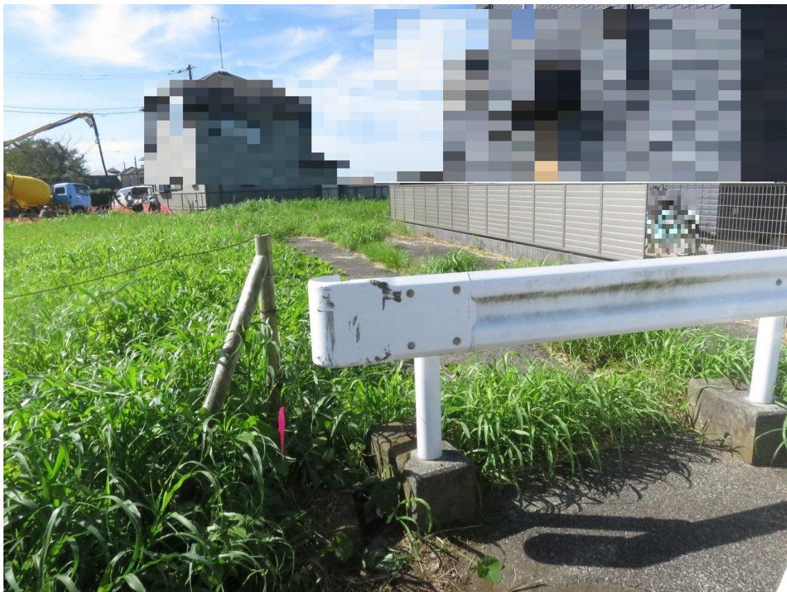
⑩ 雨水桝、汚水桝、上止水栓 (敷地内)