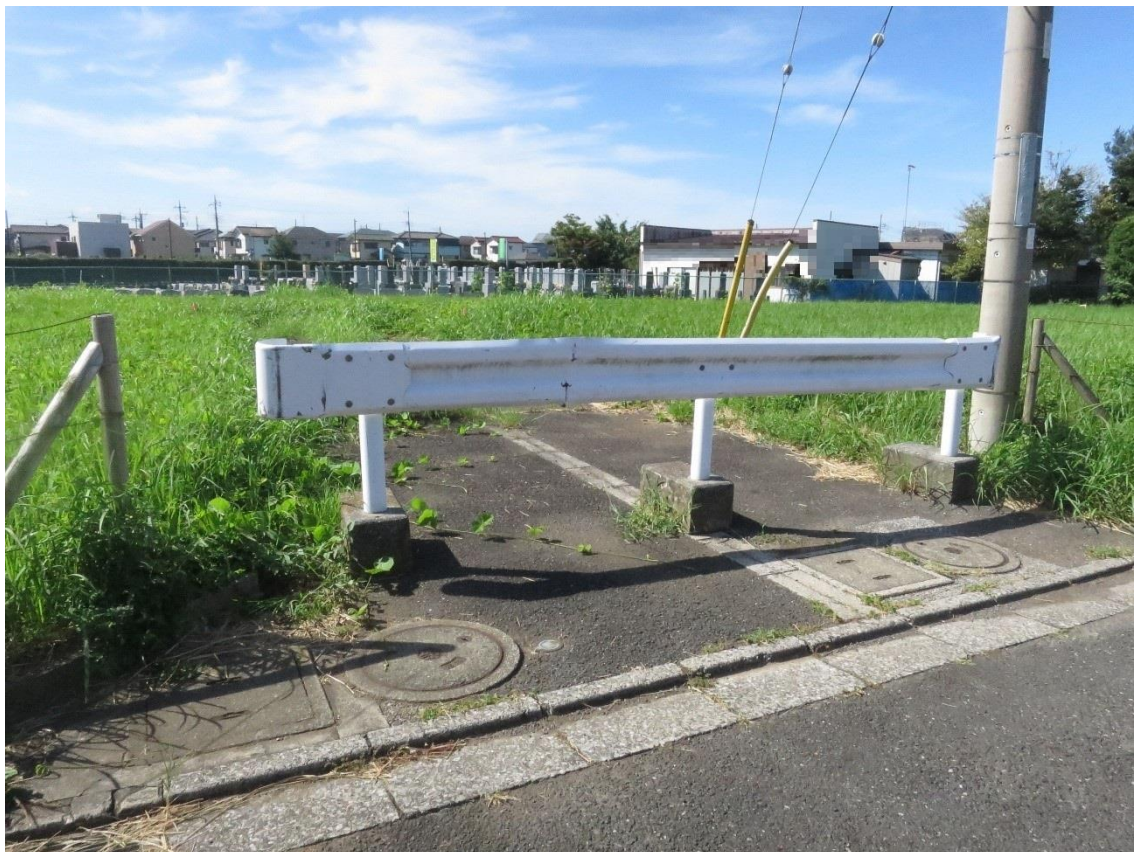
⑫ 電柱、街灯、支線、ガードレール、アスファルト（敷地内）