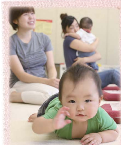
子育て支援事業：もぐもぐ教室の様子