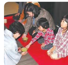
お抹茶を愉しんでみませんか

春らんまん 佐倉草ぶえの丘で春を満喫しよう！ ※記載のないものは、無料・申し込み不要 ●古民家桜まつり 開催中～4月3日(日) かやぶき屋根の古民家(旧増田家住宅)でお花見や昔ながらの遊びを楽しもう！ ▼古民家ごもお茶会 日時 4月3日(日) 午前10時30分～、午後1時30分～ ①お抹茶をいただく 費用 300円 ②おてまえ体験 要申し込み 費用 500円 対象 4歳～小学生 定員 各回10人(先着順)