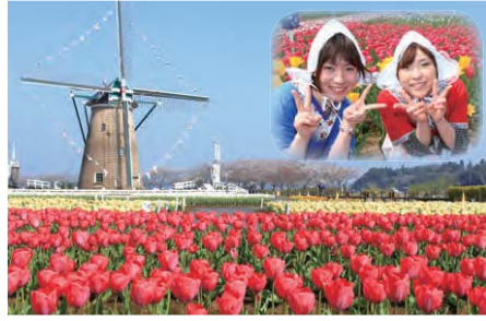
花から花へ人から人へ—— 佐倉チューリップフェスタ 2016

オランダ風車を背景に、関東最大級となる100種類71万本のチューリップが彩り豊かに咲き揃います。佐倉チューリップフェスタで春を感じてみませんか。