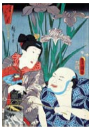
当盛六花撰のうち 菖蒲(国立歴史民俗博物館蔵)