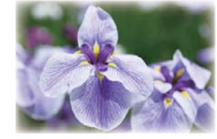
市の花・花菖蒲はアヤメ科です