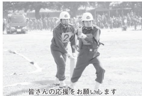
皆さんの応援をお願いします

消防団員が日ごろの訓練の成果を發揮する大会です。大会当日は佐倉城址公園 自由広場への駐車はできませんのでご協力をお願いします。日時 6月12日(日)午前7時30分〜正午(競技開始:午前8時30分) 場所 佐倉城址公園 自由広場 問い合わせ 危機管理室 消防班 ☎(484)6132