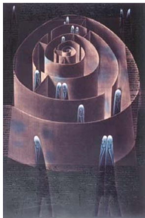
深沢幸雄《憂愁市街(迷路)》1985年 佐倉市立美術館蔵

〒285-0023 佐倉市新町210 ☎(485)7851 FAX(485)9892 muse@city.sakura.lg.jp