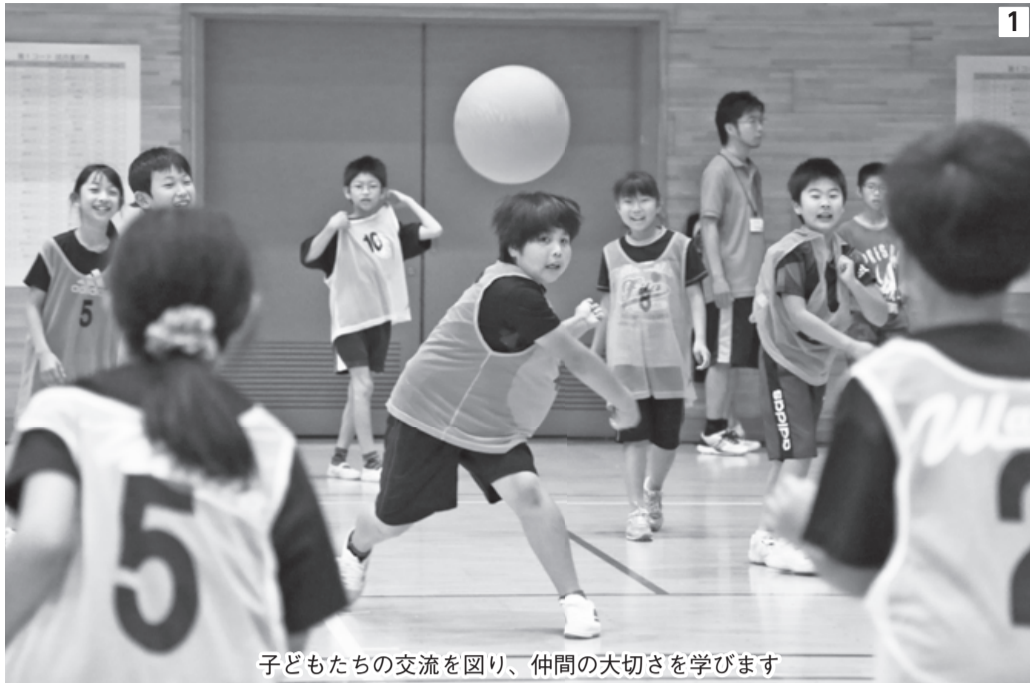
子どもたちの交流を図り、仲間の大切さを学びます