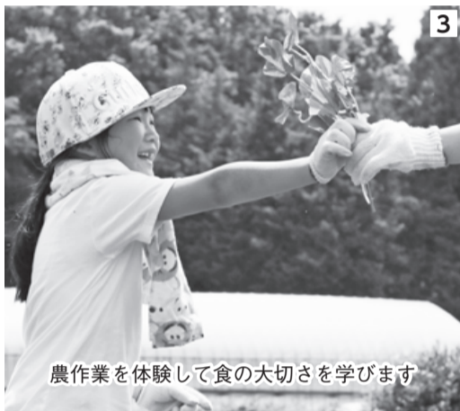
農作業を体験して食の大切さを学びます