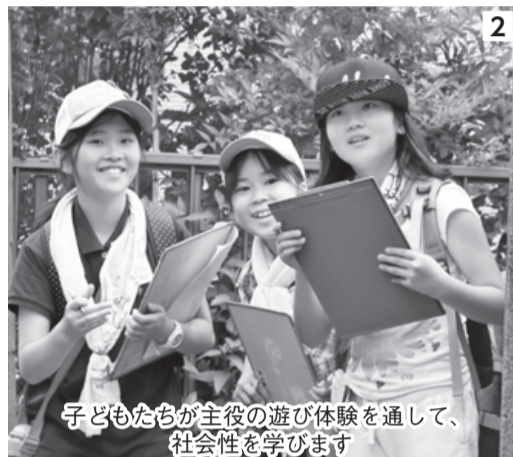
子どもたちが主役の遊び体験を通して、社会性を学びます