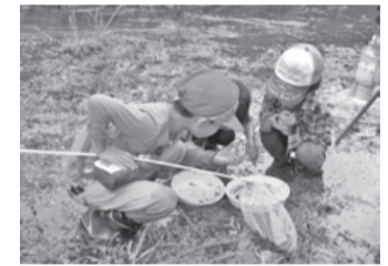
生きもの見つけ隊!

要申し込み・無料 場所 畔田谷津(佐倉西高校グラウンド下、下志津橋先の駐車スペース集合)