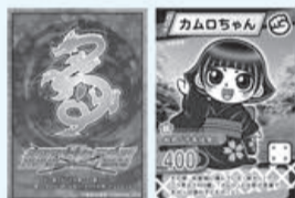
※画像は制作中のものです