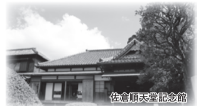
佐倉順天堂記念館

城下町佐倉の中で、日本遺産に認定された重要な構成文化財である、武家屋敷、旧堀田邸、佐倉順天堂記念館を歩いて巡ります(全行程5km)。