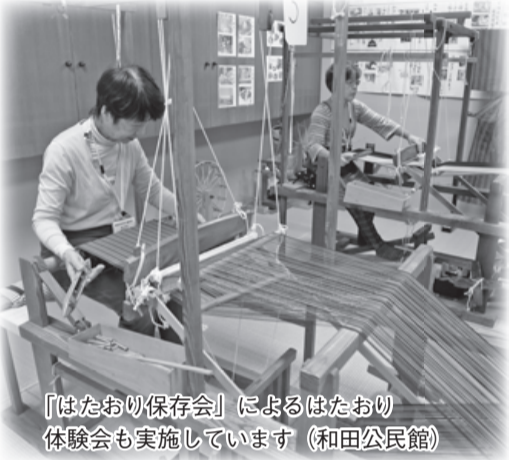
「はたおり保存会」によるはたおり体験会も実施しています (和田公民館)