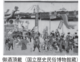
御酒頂戴(国立歴史民俗博物館蔵)

今年、慶応4年(明治元年、戊辰の年)から150年目にあたります。天保の改革以後、錦絵はメディアとしての性格を強め、政治や世相を描く錦絵は従来の役者絵や美人画、名所絵に次ぐような大きなジャンルに成長していました。1868年に出版された錦絵を選び、戊辰戦争を中心とした世の中の動きを視覚的に提示するとともに、当時の風刺画の特徴的手法についても紹介します。