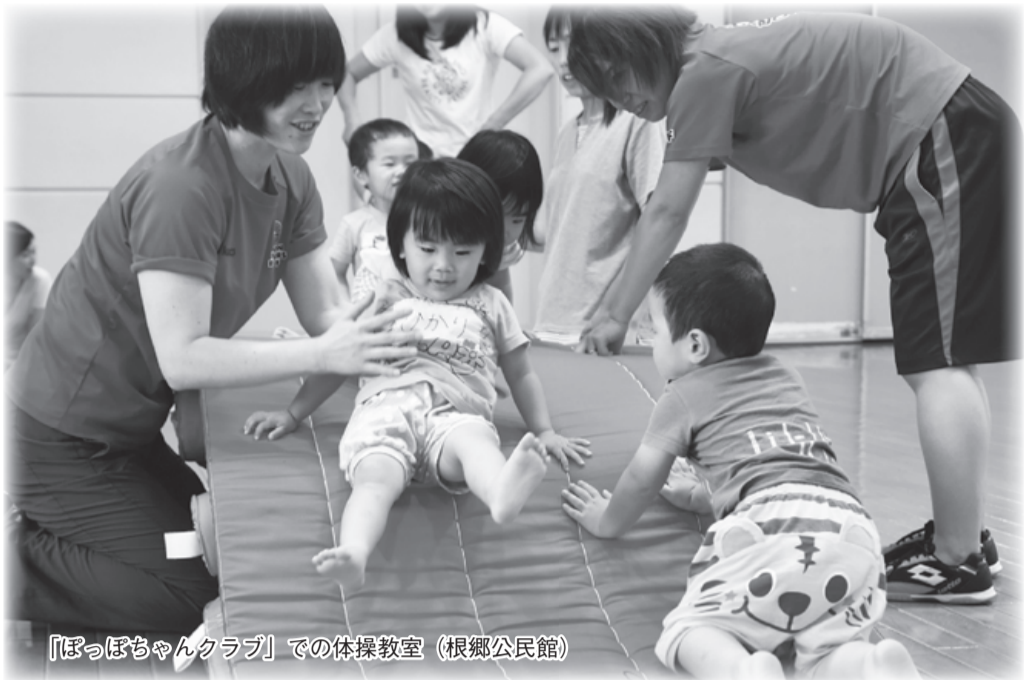
「ぽっぽちゃんクラブ」での体操教室 (根郷公民館)

公民館は、子どもから高齢者まで、幅広い年代のかたがたが集い、教養の向上や健康増進、生活文化の振興などを学び、豊かなまちづくりや人づくりを目指す場です。今回は、多様な市民のニーズに応える、特色のある事業を紹介します。