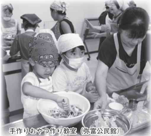
手作りおやつ作り教室 (弥富公民館)