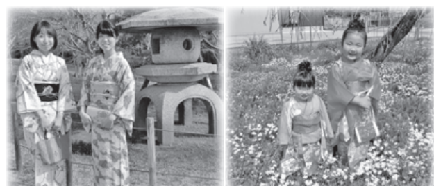
着物をレンタルして、城下町佐倉の散歩をお楽しみください。(着付けサービス)

JR東日本千葉支社が運行するサイクルトレイン「B.B.BASE」の臨時列車が佐倉に停車しました。自転車を解せず車内に搭載できるこの列車で、多くのサイクリストが佐倉を訪れ、武家屋敷周辺や自然豊かな印旛沼周辺を自転車で巡るとともに、佐倉ふるさと広場で同時開催の「佐倉サイクルフェスタ」を楽しむ姿も見られ、好評を博しました。(1月26日・27日) 今回の臨時列車は、JR両国発・JR佐倉行きで、「B.B.BASE」の運行1周年を記念して運行されたものです。通常は、JR両国から県内の内房、外房、佐原、銚子方面に運行しています。 佐倉を訪れたサイクリストたちは、「佐倉サイクルフェスタ」で波打つコース「パンプトラック」を楽しんだり、オランダ自転車などの各種自転車の試乗会に参加したり、思い思いに自転車の祭典を満喫していました。27日(日)には、お笑いコンビ「ドラングドラ