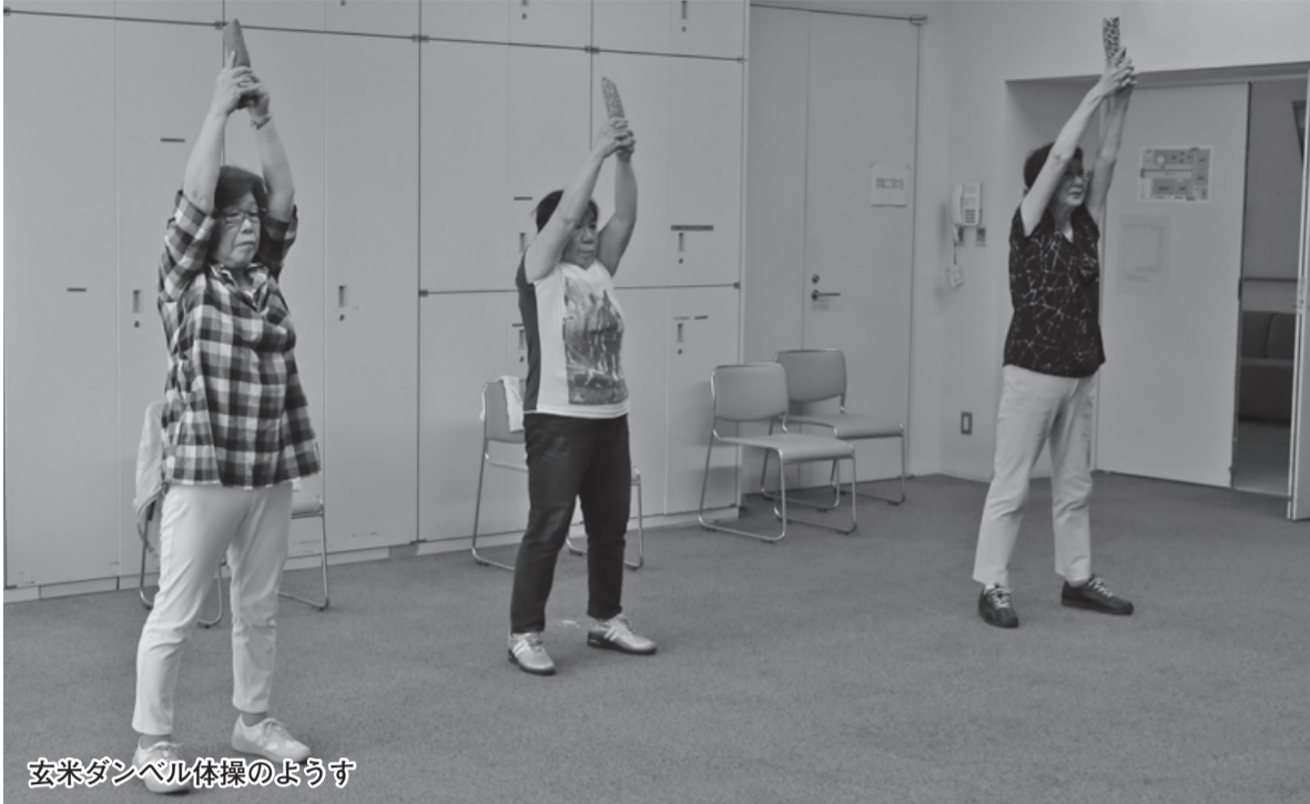
玄米ダンベル体操のようす

女性の健康づくり講演会……………2 佐倉サイクルフェスタ……………3 佐倉市ファミリーサポートセンター会員募集……………4 佐倉市災害共済加入者募集……………5 国際女性デー☆フェスタ……………8