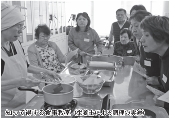
知って得する食事教室 (栄養士による調理の実演)