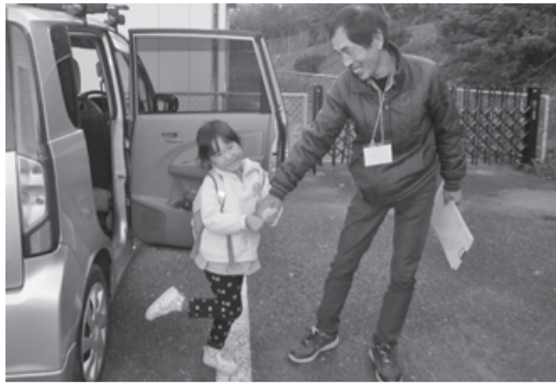
朝、自宅へお迎えに行き 保育園まで送っています

佐倉市ファミリーサポートセンターとは... 「子育てのお手伝いをしたい」「子育ての手助けをしてほしい」かたが会員となり、子育てが大変なときに地域で支援し合うシステムです。 (↓6ページに入会説明会のご案内)