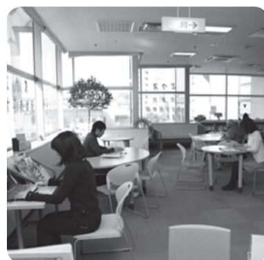
◆図書コーナーもあります

開館時間 午前9時~午後9時(年末年始除く) ※職員研修および蔵書点検のため2月19日(火)・3月4日(月)は臨時休館します 申し込み・問い合わせ ☎(460)2580 FAX(460)2582