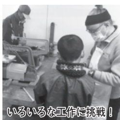
いろいろな工作に挑戦!

探究心や創造性を育てるために 日程 5月～令和3年2月(主に土曜日・全20回程度) 時間 午前9時45分～正午 場所 佐倉草ぶえの丘 費用 年2000円(保険料・基礎工作材料費) ※基礎工作以後の材料準備は各自 対象 市内在学の小学3～6年生 定員 20人(多数時抽選) 締め切り 4月10日(金) 申し込み 下記2次元コードより専用ページにて、郵便番号