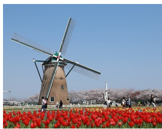
佐倉ふるさと広場