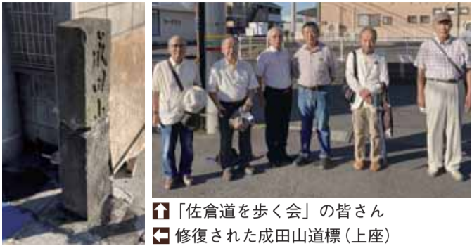
「佐倉道を歩く会」の皆さん 修復された成田山道標(上座)

上座の国道296号線(旧・成田街道)の道路脇にある「成田山道標」の修復工事が行われました。(10月4日) この道標は、成田山に徒歩で参詣する旅人を案内するため、明治27年(1894)に建立されたもので、成田街道沿いの5か所(船橋市滝台、八千代市大和田、佐倉市井野・上座、酒々井町上岩橋)に現存しています。 上座にある道標は、平成23年(2011)の東日本大震災で折れてしまい、その後、折れた上部は横に置かれたままでした。このたび、折れた道標を「佐倉道を歩く会」の