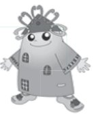
くみらくん 佐倉市民憲章 マスコット キャラクター

佐倉市民憲章は、市民が力を合わせて「ふるさと佐倉のまちづくり」を進めるため、昭和45年に制定されました。 ☎自治人権推進課 ☎484-1948