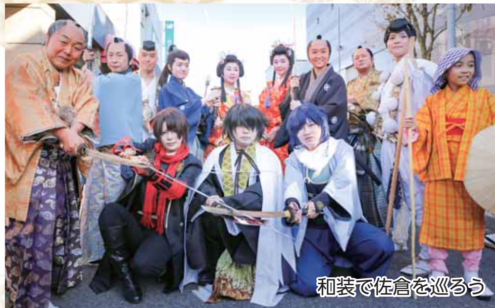
和装で佐倉を巡ろう