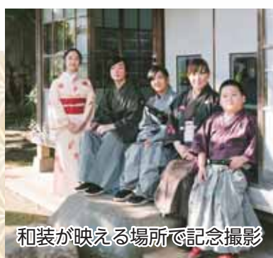
和装が映える場所で記念撮影