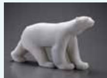
《シロクマ》1923-1933年 白色大理石 群馬県立館林美術館蔵