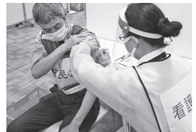
↑ 新たな感染症対策などについても柔軟に対応します

コロナ対策以外の取り組みとしては、「前立腺がん検診」や「おじいちゃん・おばあちゃんありがとうの気持ちを伝えたい事業」など、健康推進、高齢者福祉の充実に取り組みます。また、子育て支援は、現在過密状態にある学童保育所の拡充や、多胎妊婦の健康診査支援など、安心して子育てができる環境整備を進めます。