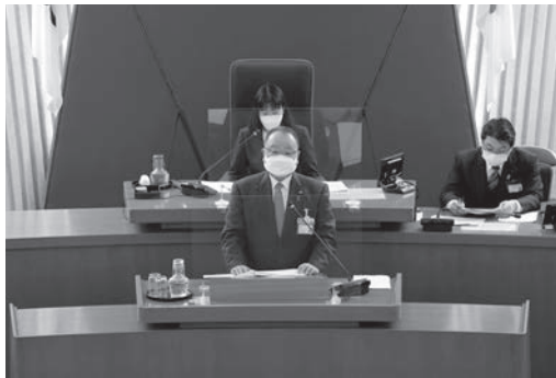
2月議会で市長が所信を表明

任期の総仕上げの年となる令和4年度、市の財政状況が今後更に厳しくなる中であっても、行政サービスの水準を保ちつつ、公約を実現することができるよう、第5次佐倉市総合計画 前期基本計画に掲げる5つの「まちづくりの基本方針」に基づく各種施策を着実に推進します。