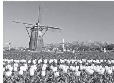
↑ 佐倉ふるさと広場

また、観光による交流人口の増加、地域活性化を図るため、「佐倉ふるさと広場」や「佐倉草ぶえの丘」などの整備・拡充を進めるとともに、観光イベントや積極的なプロモーションなどを実施します。