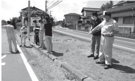
↑ 通学路危険箇所の視察

学校や地域の協力を得ながら、通学路の点検、危険箇所の把握を行うとともに、国や警察などの関係機関と連携して、交通安全対策に取り組みます。また、生活道路の補修や公園遊具の修繕など、身近なインフラ整備にも注力し、安全で安心して暮らせる地域を実現します。さらに、災害への対応として、治水対策を強化するとともに、橋梁の補修にも取り組みます。