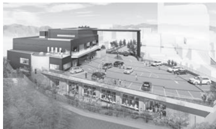
↑ 夢咲くら館外観イメージ図(令和5年3月開館予定)

また、新型コロナウイルス感染症拡大時も児童・生徒の学びを止めることがないよう、学校内の感染症対策を徹底するとともに、臨時休校時のオンライン授業などによる対応を図ります。