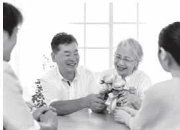
↑高齢者に感謝を伝える活動に対して支援をします