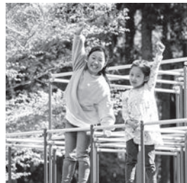
↑自然に囲まれたアスレチックで遊べる佐倉草ぶえの丘