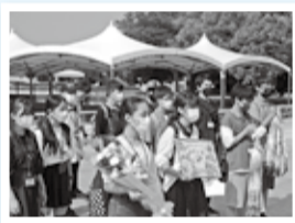
平和記念公園にて、慰霊碑に献花・折り鶴の奉納