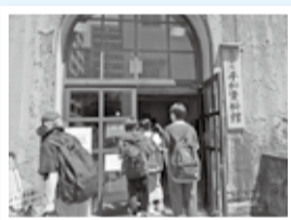
フィールドワークで広島市内の被爆地を巡る