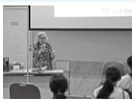
広島で被爆されたかたの体験講話