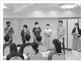
2日間の体験を振り返り、学習会・発表

参加した生徒たちは、広島で学んだことを胸に刻み、自ら学んだことや感じたことをそれぞれの学校で発表し、戦争の恐ろしさや平和の尊さをたくさんの人に伝えていきます。また、学習の報告は、平和祈念文集としてまとめた後に、12月ごろから図書館でご覧いただけます。