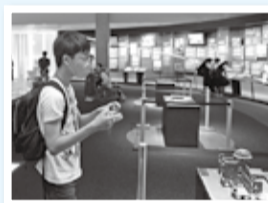
広島平和記念資料館にて、被爆者の遺品や資料を見学