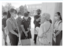
ボランティアのかたの案内で被爆の実相を学ぶ