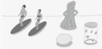
安西水丸《サーフィン》2006

観覧料 一般:800円、大学・高校生:600円、 中・小学生:400円、未就学児無料 ※20人以上の団体は2割引