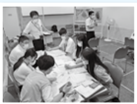
翌日のフィールドワークに向けた話し合い

参加した生徒たちは、広島で学んだことを胸に刻み、自ら学んだことや感じたことをそれぞれの学校で発表し、戦争の恐ろしさや平和の尊さをたくさんの人に伝えていきます。また、学習の報告は、平和祈念文集としてまとめた後に、12月ごろから図書館でご覧いただけます。