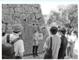
広島市内を視察(広島城など)

佐倉平和使節団の様子は、佐倉市広報番組「weekly さくら」で放送するほか、佐倉市公式 You Tube「さくら動画配信」でも配信予定です(8月22日～)。また、佐倉市平和式典の様子を8月15日(月)午前11時55分からライブ配信予定です。(右記参照)