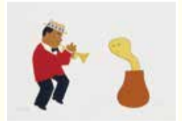
安西水丸《アドリブ》和田誠氏との二人展 AD-LIB 展より 2008

本展では千葉ゆかりの作家として、安西の幼少期から晩年に至るまでの多岐にわたる作品や関連資料など500点以上を紹介し、膨大な資料を通して、安西の歩んだ軌跡を振り返る県内初の回顧展を是非ご覧ください。