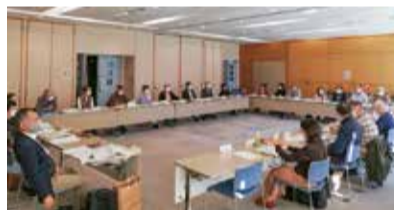
定例会では福祉の制度などを学び、相談に対応する知識を身につけます。