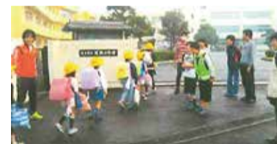
あいさつ運動の様子