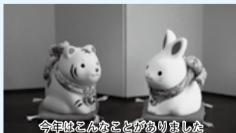
今年はこのことがありました

■放送時間(各20分) 月～金曜日 10:00～、22:00～ 土・日曜日 10:00～、正午～、22:00～